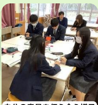
自分の意見を伝え合う様子