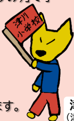
津小太郎 (津川小制作)