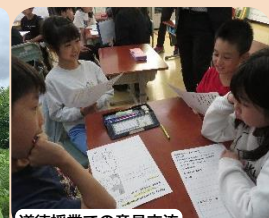
道徳授業での意見交流