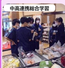
中高連携総合学習