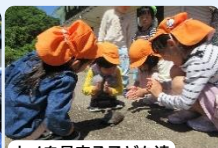
カメラを見守る子ども達