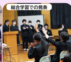
総合学習での発表